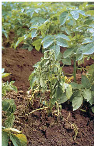
Fot 1 i 2. Wędnące rośliny ziemniaka