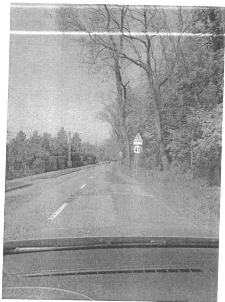
Szczodre - kierunek Łosice